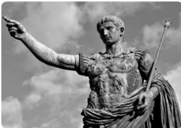
▲ César Augusto, primer emperador de Roma. Estatua monumental de bronce en el centro de Roma.