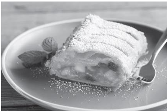
Strudel de manzanas

Observa las siguientes imágenes y responde: