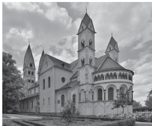
Iglesia de San Cástor, ubicada en Alemania.

Explica por qué ambas construcciones son similares.