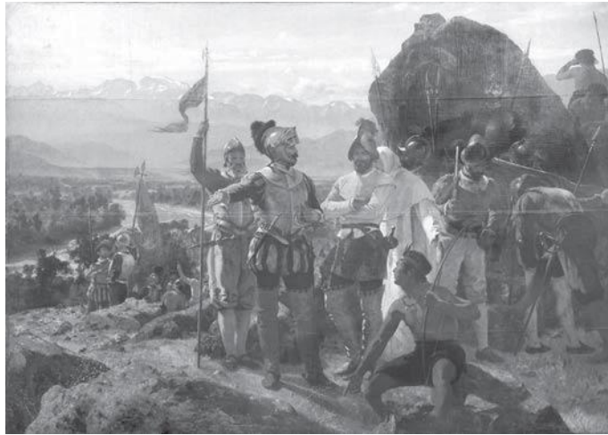
La fundación de Santiago, por Pedro Lira (1889).

1 ¿Cómo se retrata el encuentro entre españoles e indígenas? Explica.