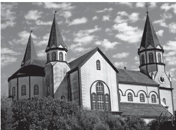
Iglesia del Sagrado Corazón de Jesús, en Puerto Varas.