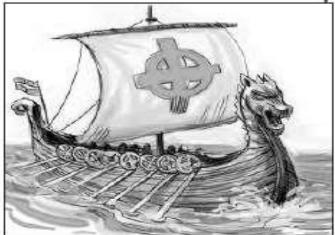
Los vikingos diseñaron y construyeron barcos largos como el que se muestra.

También tenían un truco para encontrar su ruta a tierra firme.