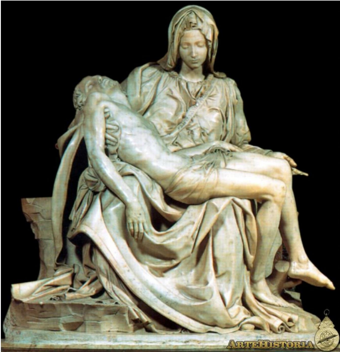
Imagen 3: "Las cuatro estaciones" Vivaldi

https://www.youtube.com/watch?v=qMnHl1KN9kE