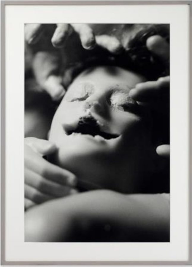
Imagen 7: fotografías de Matthew Barney

Asignatura: Estética Profesor: Víctor Merino