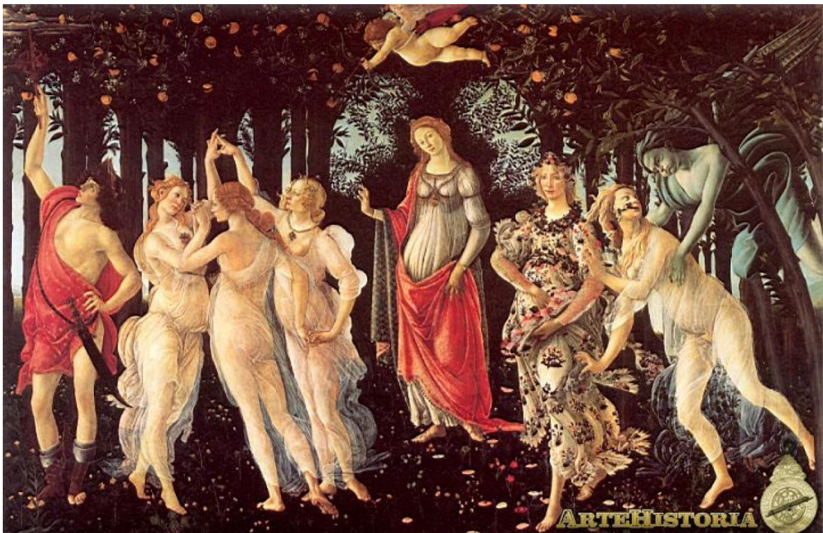
Imagen 1: "Alegoría de la primavera" Botticelli

2- Utilizando como pauta lo que respondiste en las preguntas anteriores, observa las siguientes obras de artes y ordénalas según si las consideras bellas o feas.