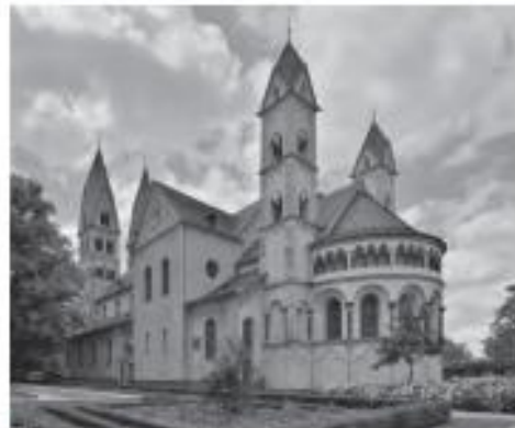
Iglesia de San Cástor, ubicada en Alemania.

2 Explica por qué ambas construcciones son similares.