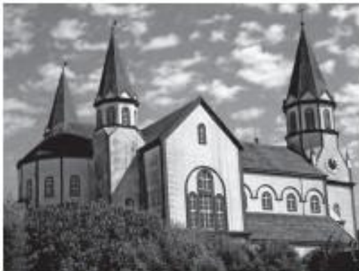
Iglesia del Sagrado Corazón de Jesús, en Puerto Varas.