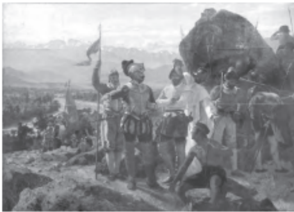
La fundación de Santiago, por Pedro Lira (1889).

1 ¿Cómo se retrata el encuentro entre españoles e indígenas? Explica.