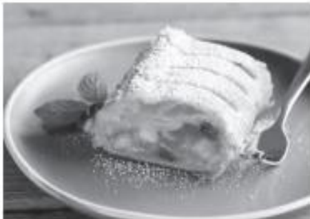
Strudel de manzanas

Observa las siguientes imágenes y responde: